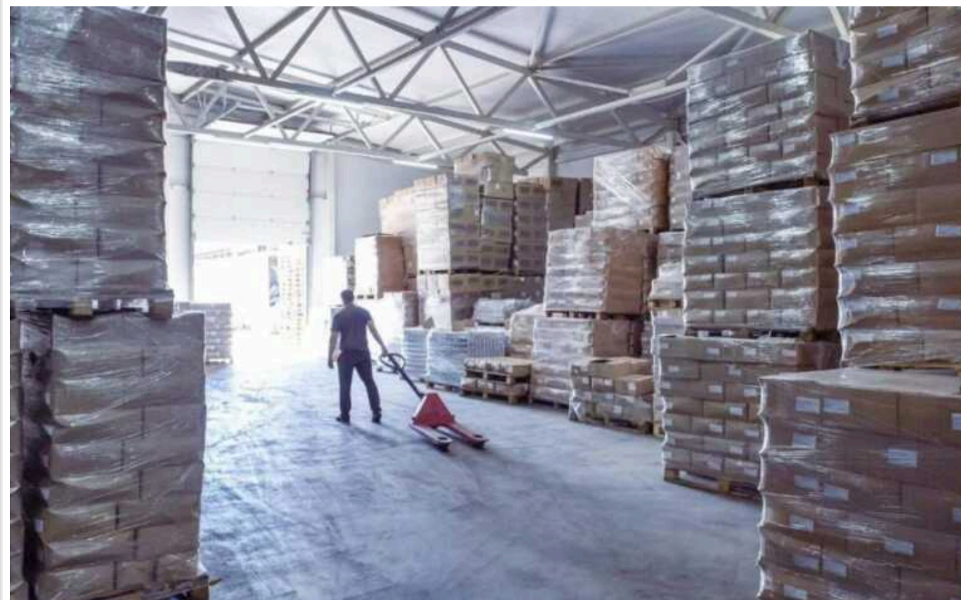
Зменшували порції військовим на 30%. Розслідування корупційної схеми постачальників Міноборони

Компанії «Грант Консалт», «Міт Мікс» та «Актив Компані», які потрапили в скандал щодо реалізації яєць по 17 гривень у Міноборони, розробили схему з привласнення 30% продуктів, які постачалися для ЗСУ.