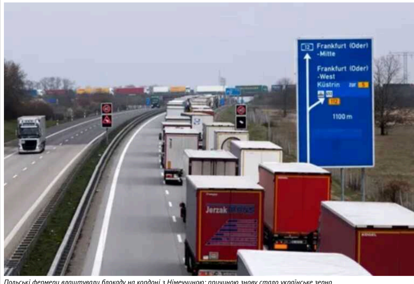
Польські фермери влаштували блокаду на кордоні з Німеччиною: причиною знову стало українське зерно

Польські протестувальники з 25 лютого вийшли на блокаду прикордонних переходів із Німеччиною. 26 лютого протести продовжились, припарковані на трасі трактори викликали проблеми з рухом транспорту на кордоні Польщі та Німеччини. Польські аерарії виступають проти постачання зерна з України до Німеччини через те, що українська продукція витісняє польську.