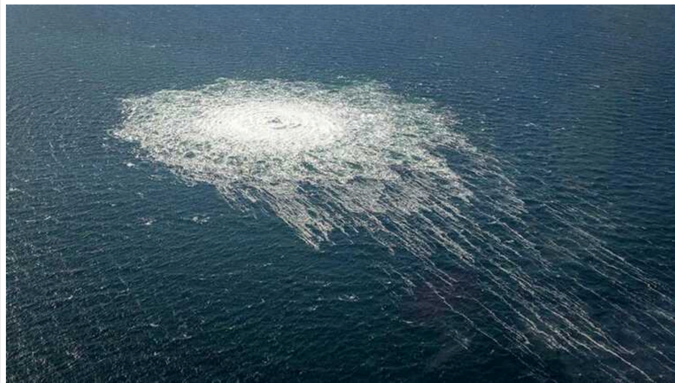
Данія як і Швеція припиняє розслідування підриву «Північних потоків»