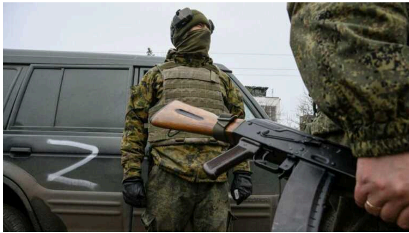
Окупант на полі бою викидає свою зброю, щоб легше було тікати

У Мережі опубліковано відеозапис атаки українських операторів дронів на ворожу бронемашину з десантом на Аджітському напрямку.