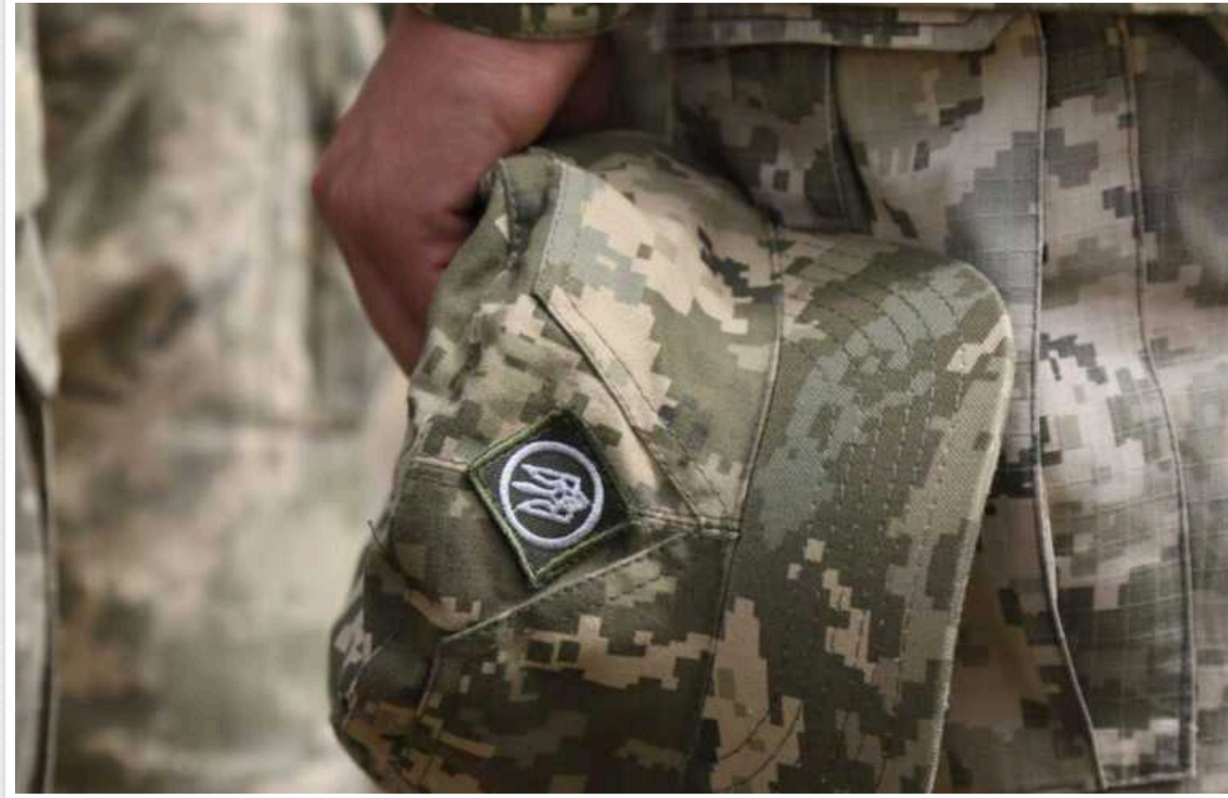
NYT: Озвучені Зеленським дані про кількість загиблих воїнів значно відрізняються від оцінок США

Дані Президента України Володимира Зеленського щодо 31 тисячі загиблих українських захисників від початку повномасштабного вторгнення сильно відрізняється від оцінок офіційних осіб США. Вони стверджували, що втрати становлять близько 70 тисяч воїнів.