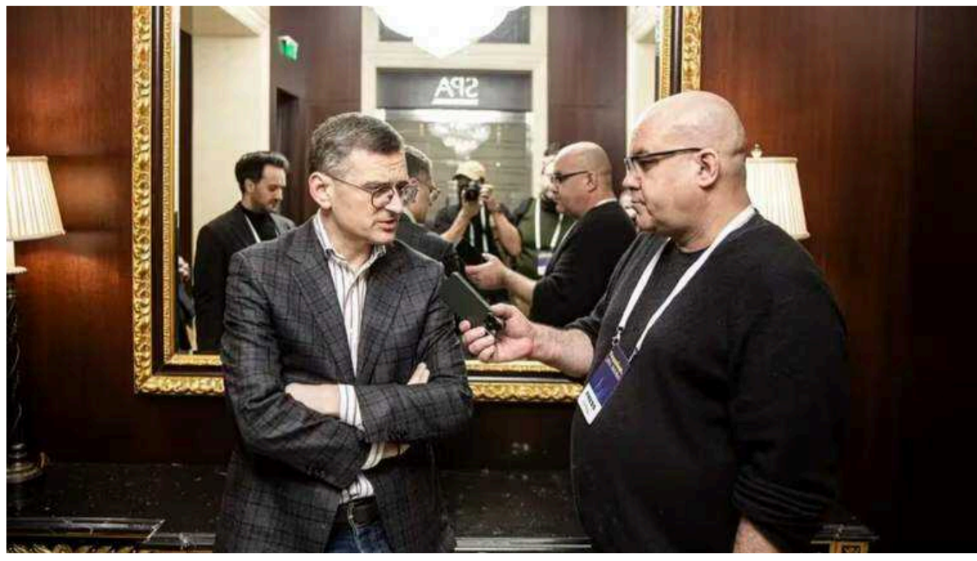
В МЗС України закликали заборонити експорт боєприпасів з Європи усім, окрім України

Міністр закордонних справ України Дмитро Кулеба заявив, що потрібно заборонити експорт боєприпасів з Європи до третіх країн. Усе озброєння, на думку міністра, має надходити в Україну для захисту Європейського Союзу.