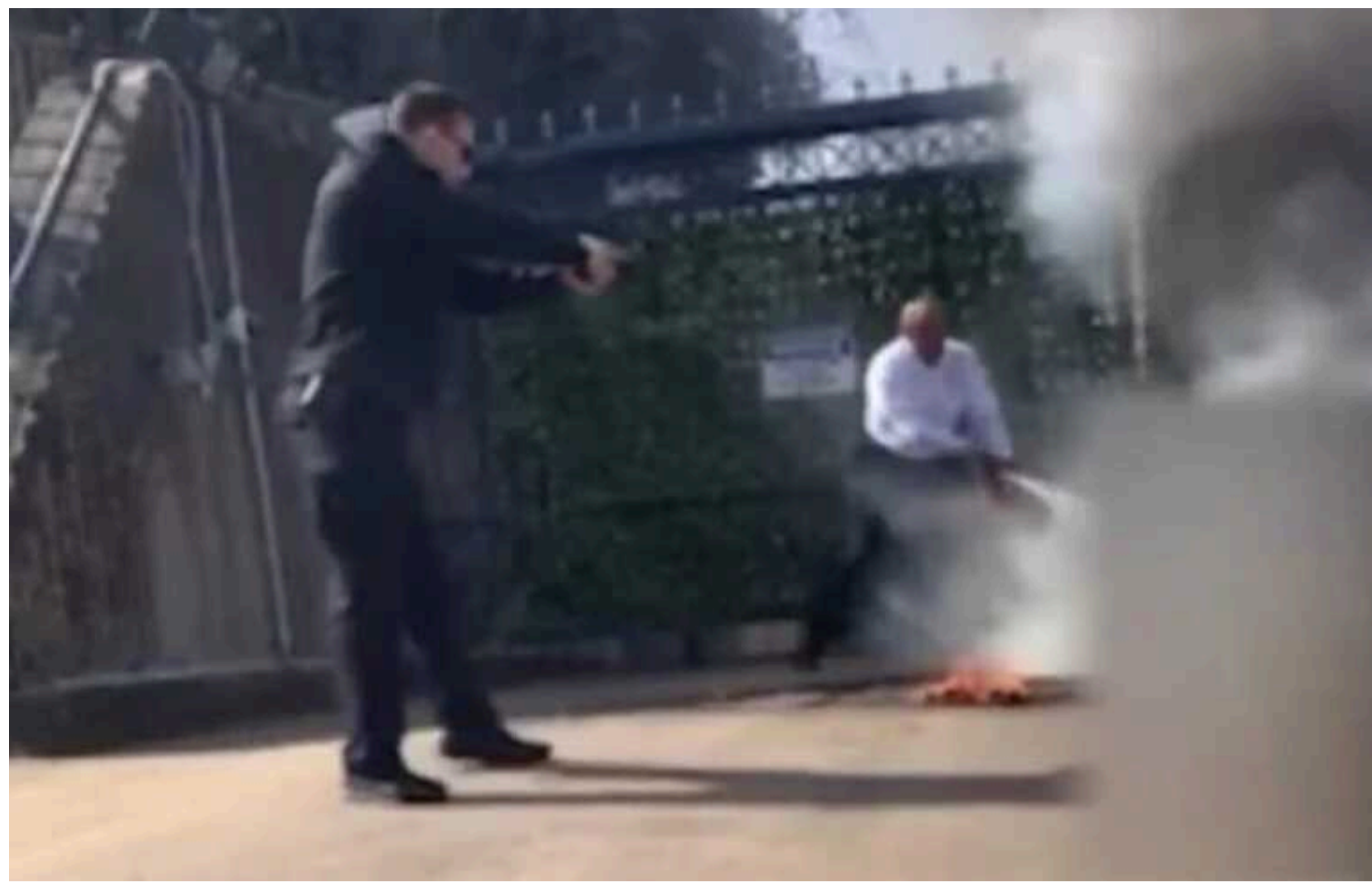
Біля посольства Ізраїлю у Вашингтоні американський льотчик вчинив самопідпал

Військовослужбовець ВПС США підпалив себе біля посольства Ізраїлю у Вашингтоні. Він кричав, що не хоче бути «співучасником геноциду», й закликав звільнити Палестину.