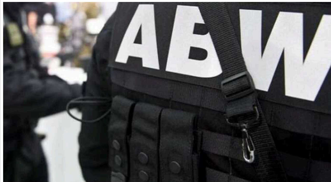
Німецькі спецслужби побоюються, що ЗСУ вичерпають запаси снарядів до червня

І тому західні країни терміново шукають варіантів, де у світі знайти боеприпаси для України.