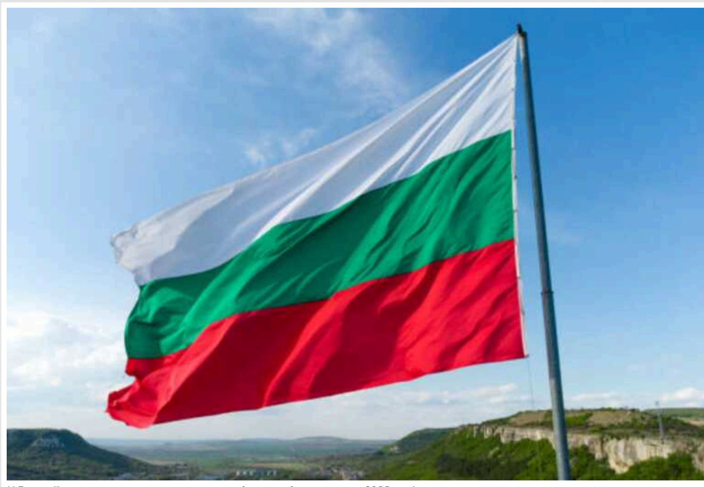
У Болгарії вважають реальними шанси приєднатися до єврозони у 2025 році

Болгарія має реальні шанси приєднатися до єврозони у 2025 році, оскільки зможе виконати всі умови для членства.