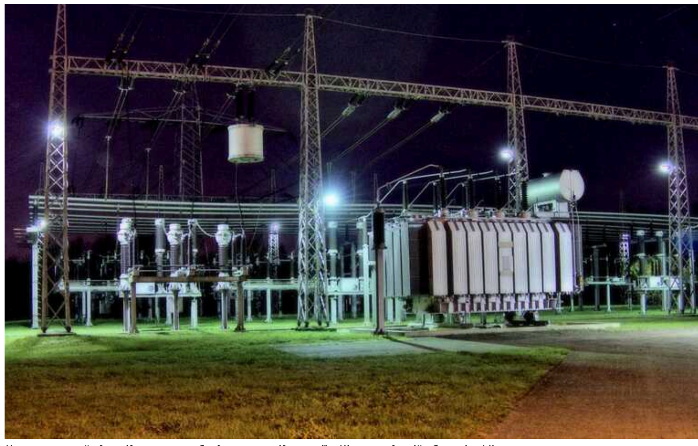
Через ракетний удар відключалося обладнання на підстанції в Кіровоградській області, – Міненерго

Внаслідок бойових дій та технічних проблем деякі лінії електропередачі та підстанції в Україні були тимчасово знеструмлені, але загалом енергосистема залишається збалансованою.