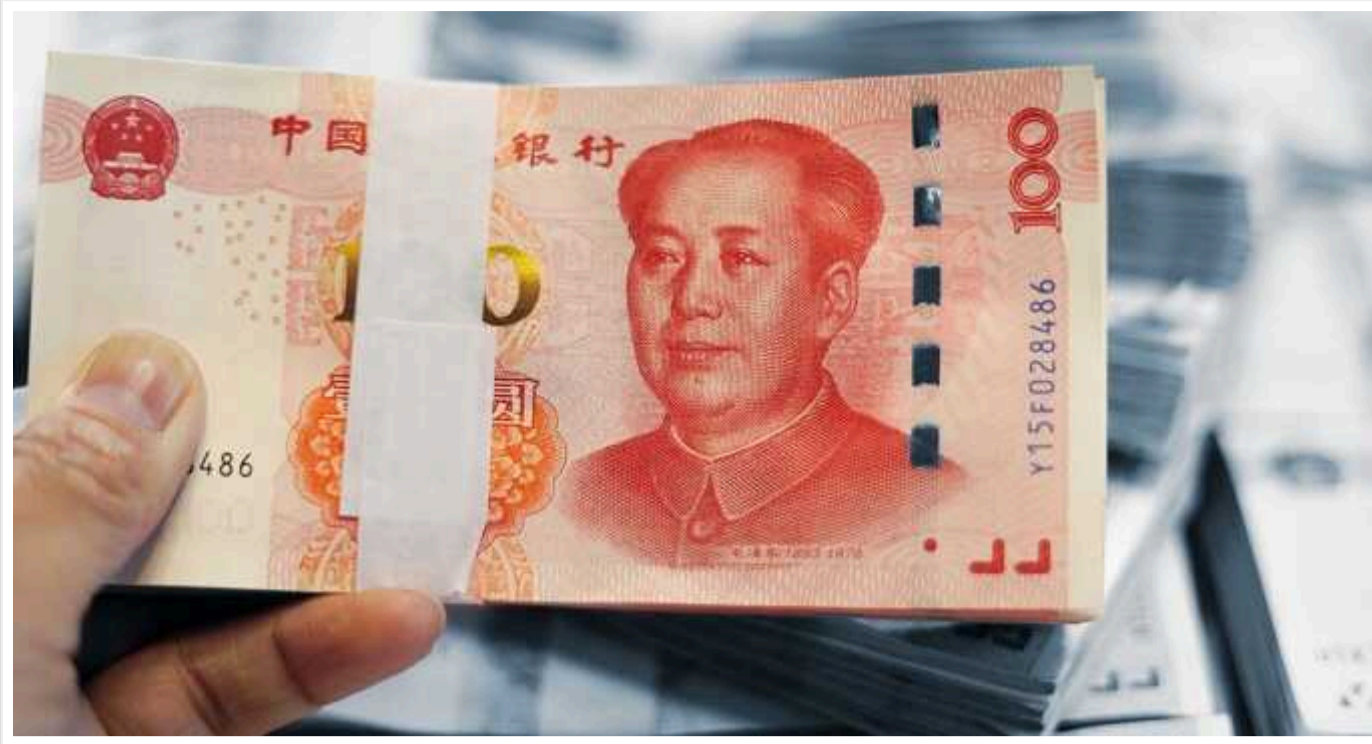
Росія хоче взяти кредит у КНР у юанях

Міністерство фінансів Росії обговорює з Пекіном можливість отримання кредитів у юанях, але рішення поки що не прийнято.