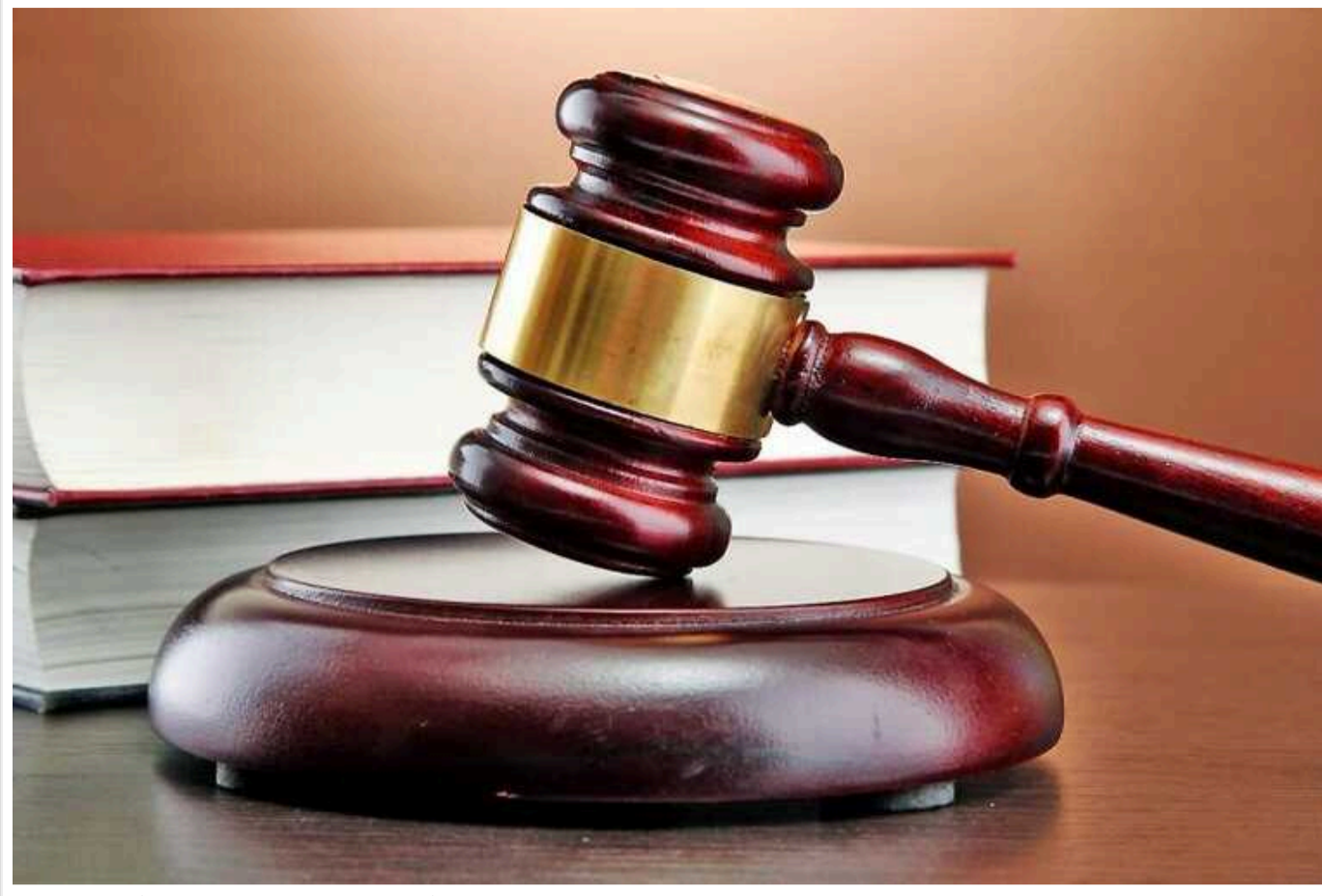
У столиці суд визнав винною жінку, яка під час конфлікту смертельно травмувала чоловіка

У Києві суд визнав винною жінку, яка під час конфлікту смертельно травмувала чоловіка. Крім того, у дворі будинку вона також поранила свою знайому.