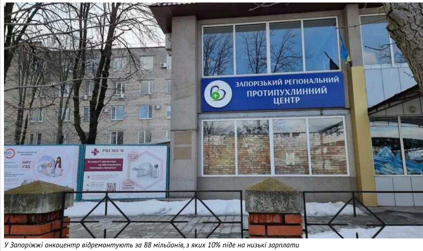
У Запоріжжі онкоцентр відремонтують за 88 мільйонів, з яких 10% піде на низькі зарплати

КНП «Запорізький регіональний протипухлинний центр» Запорізької обласної ради показало кошторис реконструкції будівель за 88 млн грн. Це зробили у відповідь на запит «Центру протидії корупції». Зарплати виявилися низькими, а ціни – подекуди дещо завищеними.