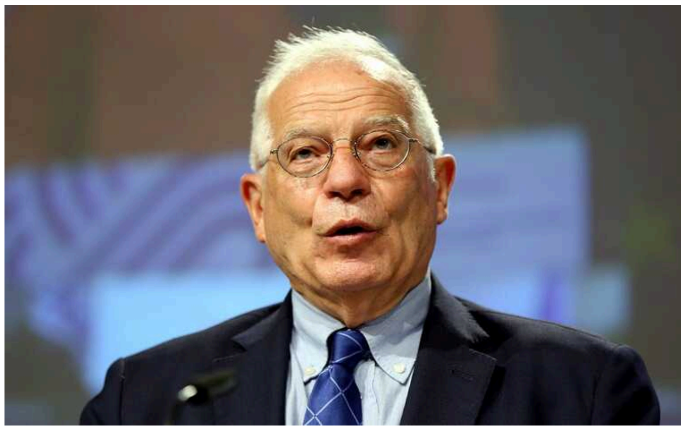
Боррель заявив, що результат війни може вирішитися найближчими місяцями: закликав європейців підтримати Україну

Європі час би "прокинутися", усвідомити, в якому небезпечному світі вона існує, і збільшити підтримку України. За словами верховного представника ЄС із закордонних справ і політики безпеки Жозепа Борреля, результат російсько-української війни може вирішитися в найближчі місяці.