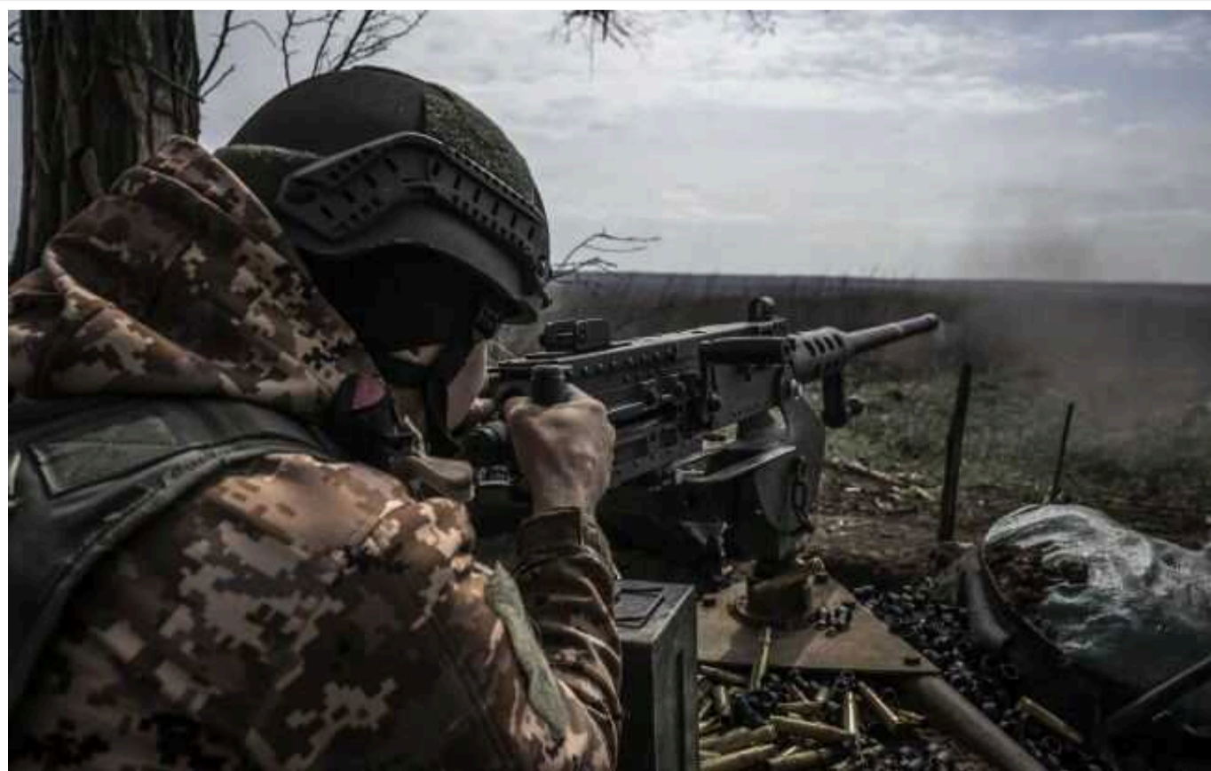
Deep State опублікував кадри виходу ЗСУ з Ласточкино

Український паблік Deep State опублікував кадри виходу ЗСУ з Ластічиного на захід від Авдіївки.