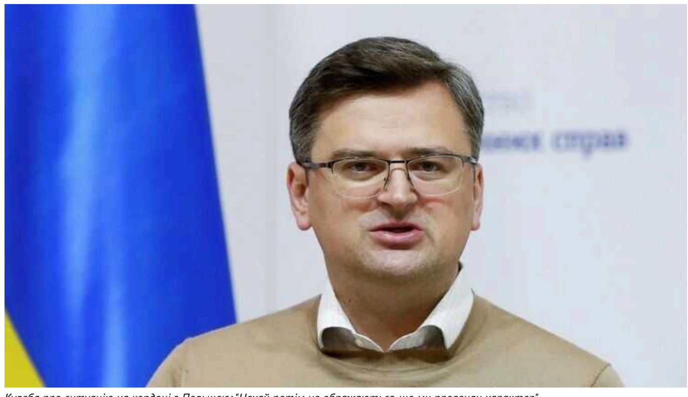
Кулеба про ситуацію на кордоні з Польщею: "Нехай потім не ображаються, що ми проявили характер"

Зараз всю відповідальність за проблеми європейських фермерів намагаються скинути на Україну.