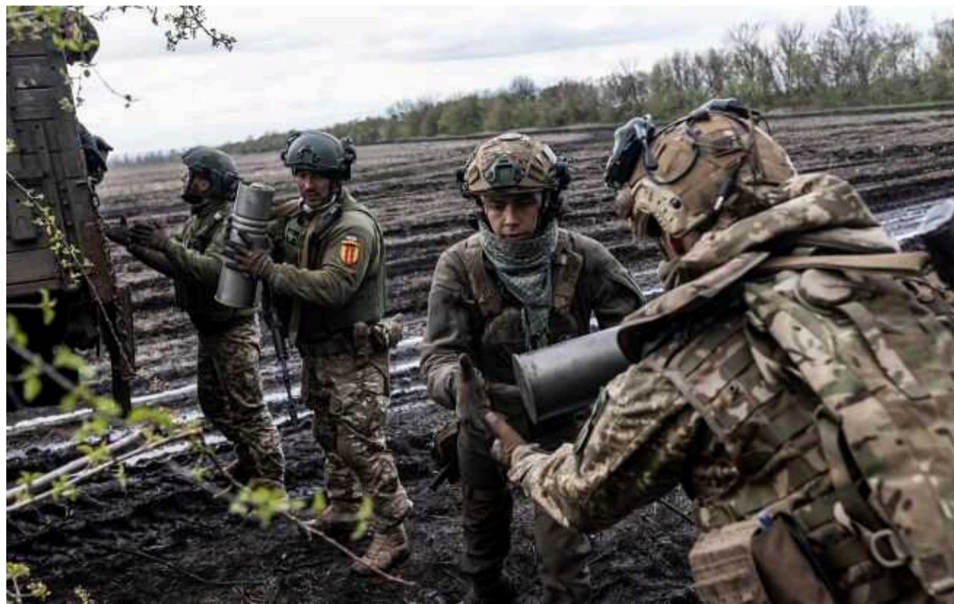
Між Східною та Західною Європою окреслився розкол через нездатність забезпечити зброєю Україну, – Bloomberg

У країнах Європейського Союзу досі триває дискусія через нездатність вчасно відправити Україні один мільйон артилерійських снарядів. Суперечка стала свідченням глибшого розколу між Західною та Східною Європою.