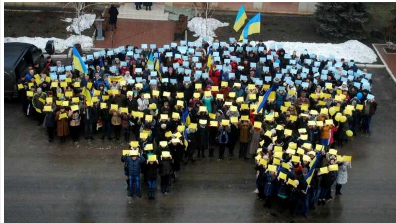
Інститут демографії: населення України у межах 1991 року скоротилося до 35 мільйонів

Демографічні втрати України, зокрема, пов'язані з рівнем народжуваності, що впав на третину порівняно з 2021 роком. Окрім того, 6,5 млн. українських біженців проживають за кордоном.