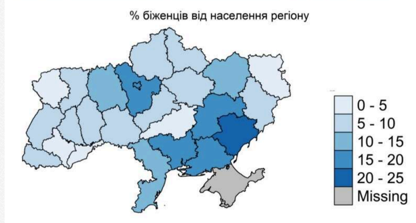
Рисунок 5. Відсоток населення з кожної області, що виїхало за кордон (окрім росії і Білорусі)

Щоб спрогнозувати демографічну ситуацію в майбутньому, додав Гладун, необхідно враховувати рівень знижується народжуваності, і рівень надсмертності – це різниця між природним рівнем смертності та фактичним з урахуванням війни, що триває.