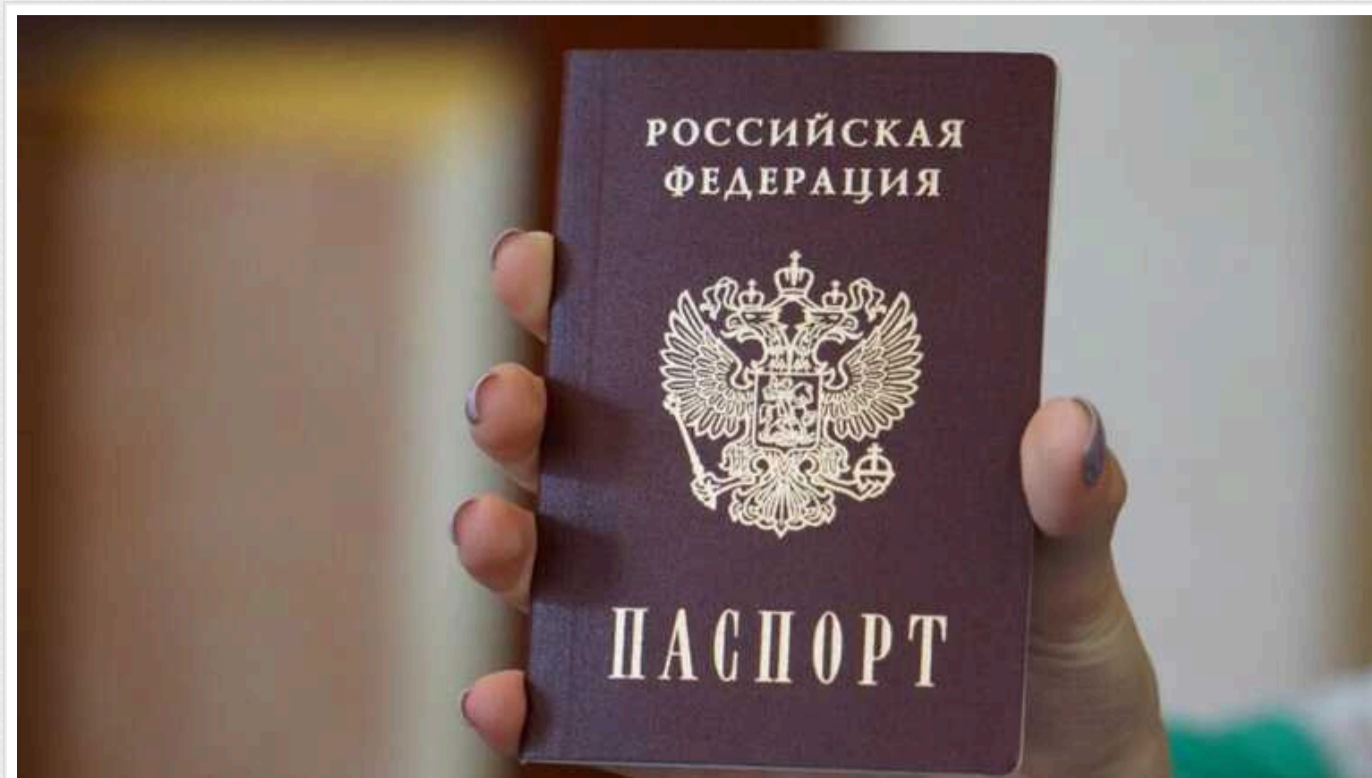
Росіяниці відмовилися продавати воду в аеропорту Рима через її паспорт: "Розпорядження МЗС Італії"

Громадянки країни-терористки відмовилися продати воду в найбільшому аеропорту Італії Ф'юмічіно, що в Римі. За словами самої "жертви", продавчиня, побачивши її паспорт, заявила, що "росіянам воду продавати заборонено".