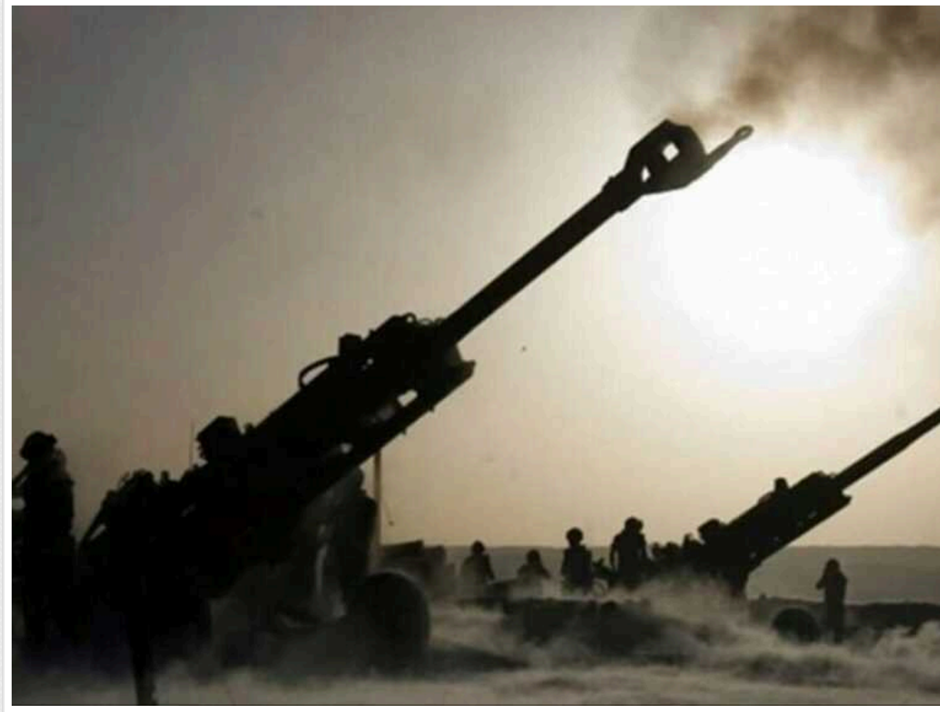
Окупанти вбили двох жителів Херсонщини: унаслідок обстрілу загинули на власному подвір'ї

Російські війська вдень 25 лютого обстріляли село Тягинка на Херсонщині. Загинули двоє мирних жителів – 44-річний чоловік і 62-річна жінка.