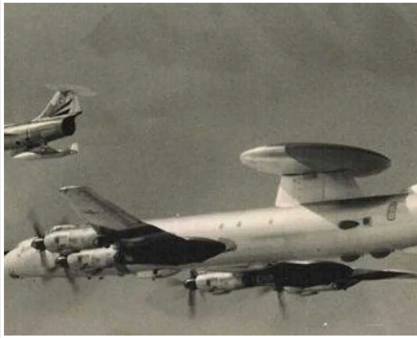
Ту-126: яким був радянський попередник російського А-50 та що з ним сталося

Українські воїни 23 лютого збили вже другий російський літак дальнього радіолокаційного стеження А-50. Після цього у мережі з'явилася чимало інформації про цей "літаючий радіолокатор".