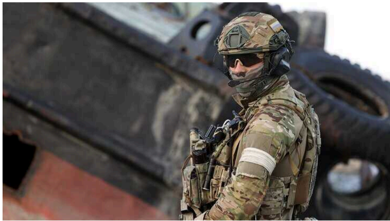
Окупанти розстріляли 9 беззбройних українських полонених на Бахмутському напрямку

За попередньою інформацією, це трапилось вчора 24 лютого. Розстріляними, імовірно, є бійці 92 ОМБр або хтось із приданих їм підрозділів.