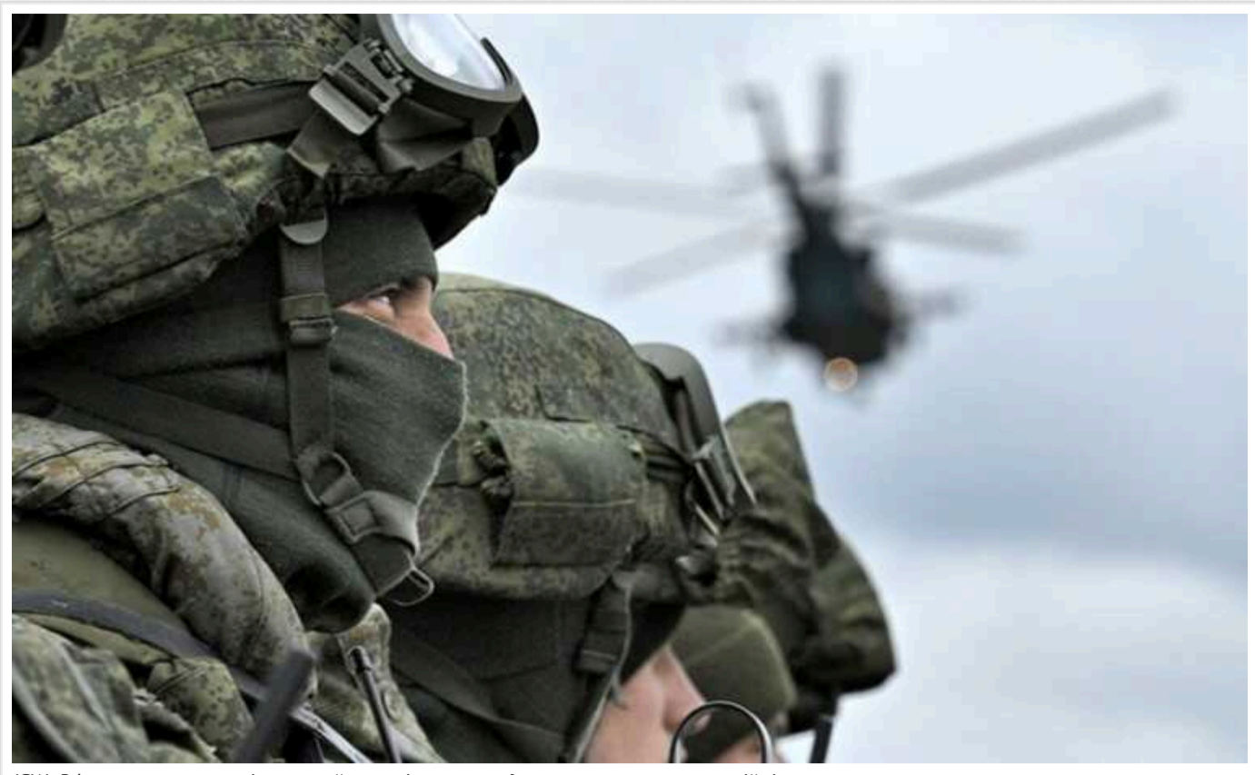
ISW: РФ поки генерує нові сили майже еквівалентно до поточних втрат на війні

Росія поки що генерує нові сили приблизно зі швидкістю, еквівалентною поточним своїм втратам, проте неясно, чи зможе підтримувати наступальні операції в такий самий спосіб на більш високому оперативному рівні зі ще більшими втратами.