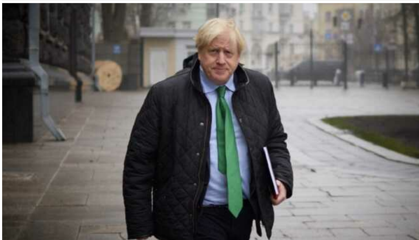
Борис Джонсон запевнив, що Україна має змогу повернути окупований Крим: «Дуже цікаві перспективи»

Колишній прем'єр-міністр Великої Британії Борис Джонсон впевнений, що Україна має шанси повернути Крим, – за два роки повномасштабного вторгнення Росії українці зуміли переконати світ у тому, що Росія на окупованому півострові дуже вразлива. Політик також розповів, що саме потрібно Україні для того, аби звільнити окупований з 2014 року Крим.