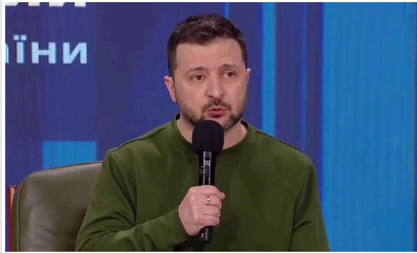
Я перебуваю в позитиві після нещодавньої відповіді наших партнерів щодо цієї зброї, – Зеленський про АТАСМС

За словами Володимира Зеленського, Україна розраховує отримати далекобійні ракети від США, і Росія розуміє, як Сили оборони використовуватимуть це озброєння на фронті.