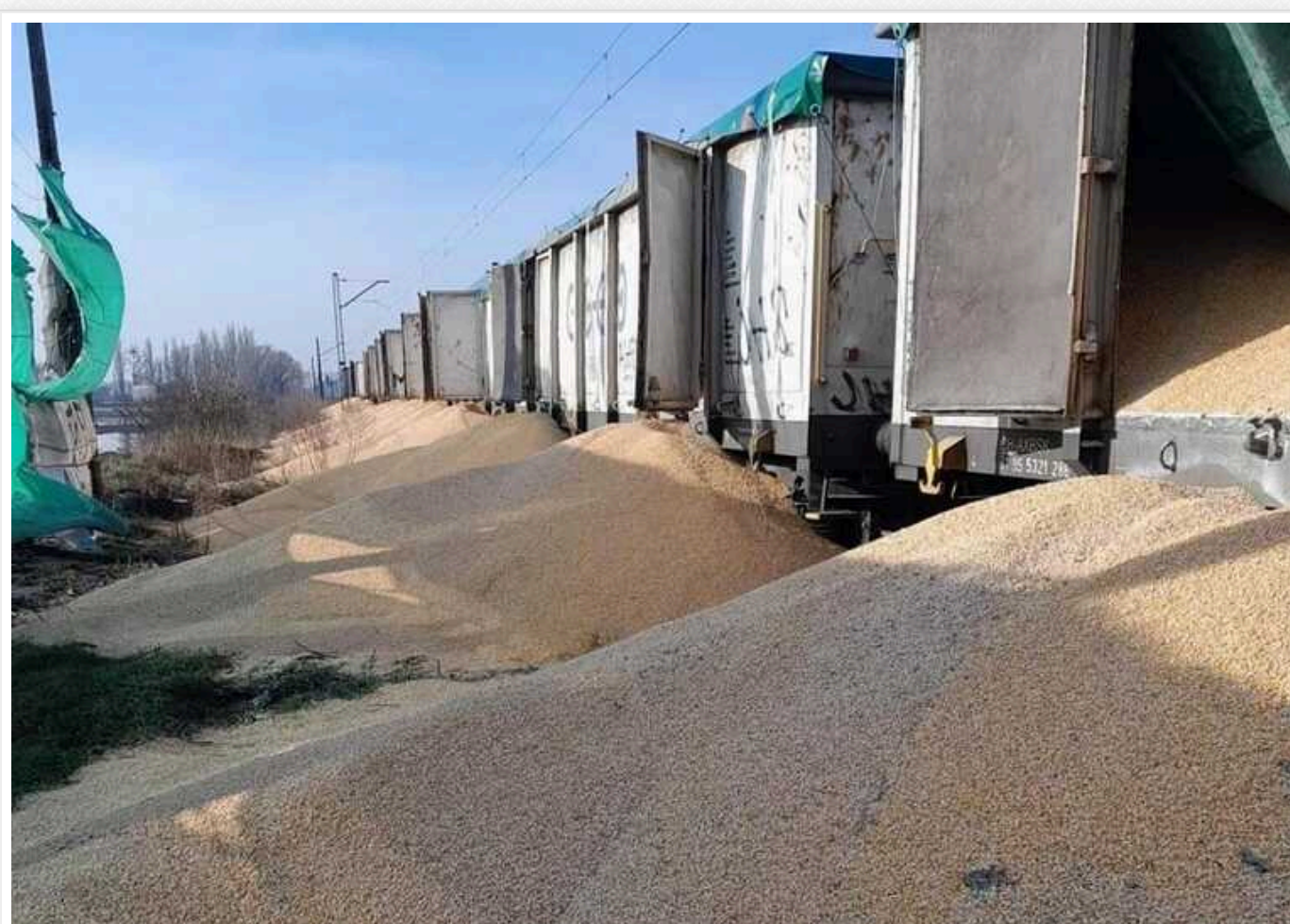
У Польщі вже вчетверте за місяць висипали зерно з України: цього разу постраждали 10 вагонів кукурудзи

На цю ситуацію різко відреагував міністр інфраструктури Олександр Кубраков.