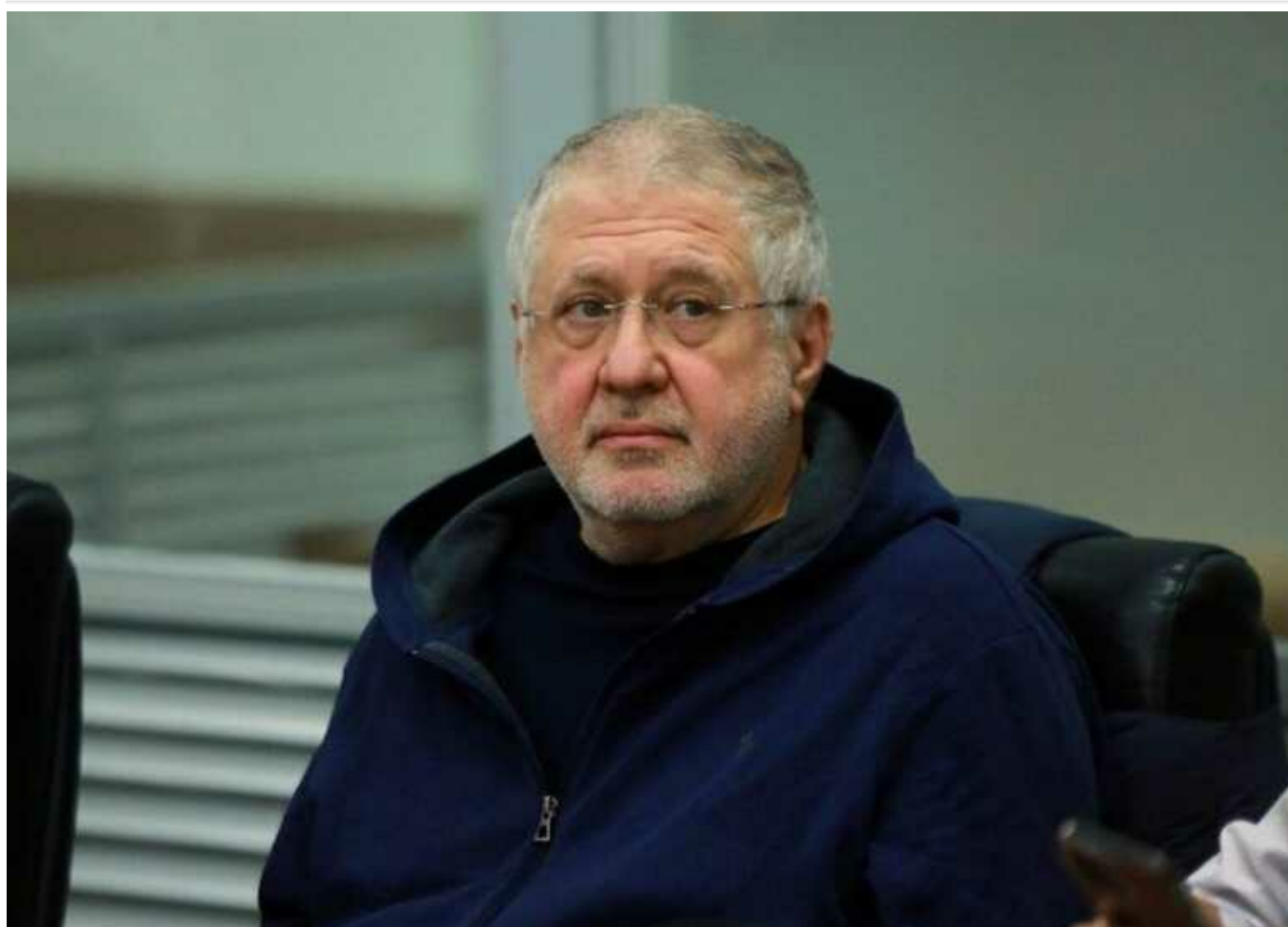
Коломойський запустив дискредитаційну кампанію проти суддів, – ЗМІ

Бізнесмен Ігор Коломойський, який є підозрюваним у кримінальній справі за шахрайство та відмивання грошей, розпочав інформаційні атаки на суддів.