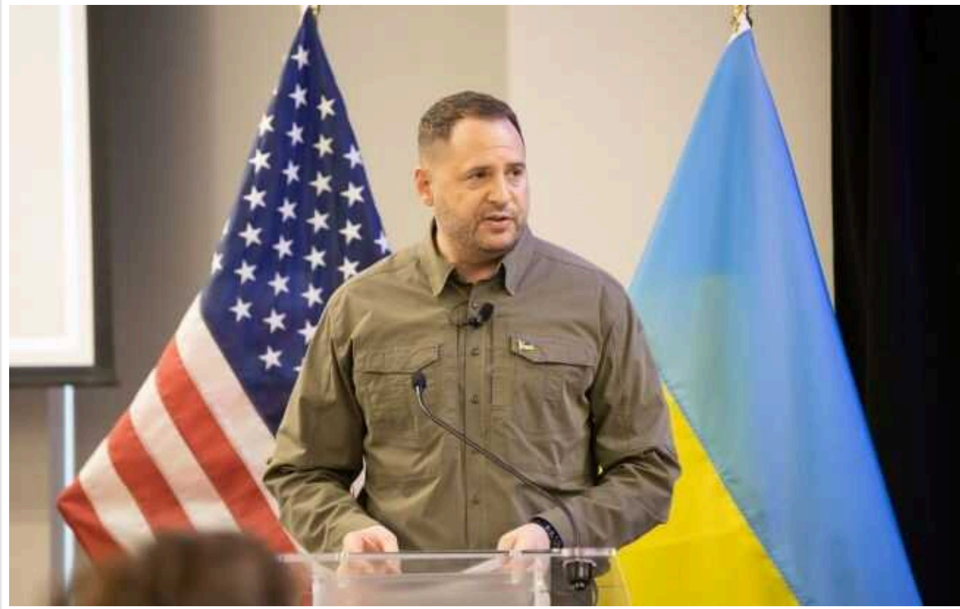
Єрмак допустив участь Росії у глобальному саміті миру, але не в першому

Читати на русском Додати як бажане джерело в Google