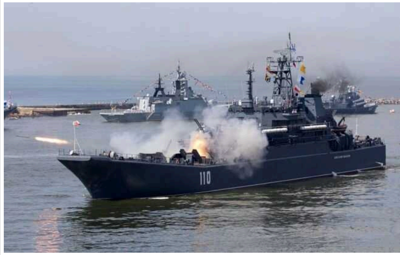
Україна завдала РФ стратегічної поразки в Чорному морі, – британська розвідка

З початку повномасштабної війни Україна завдала країні-агресору Росії стратегічної поразки в Чорному морі. Це змусило Чорноморський флот РФ передислокувати свої основні підрозділи до східної частини акваторії.