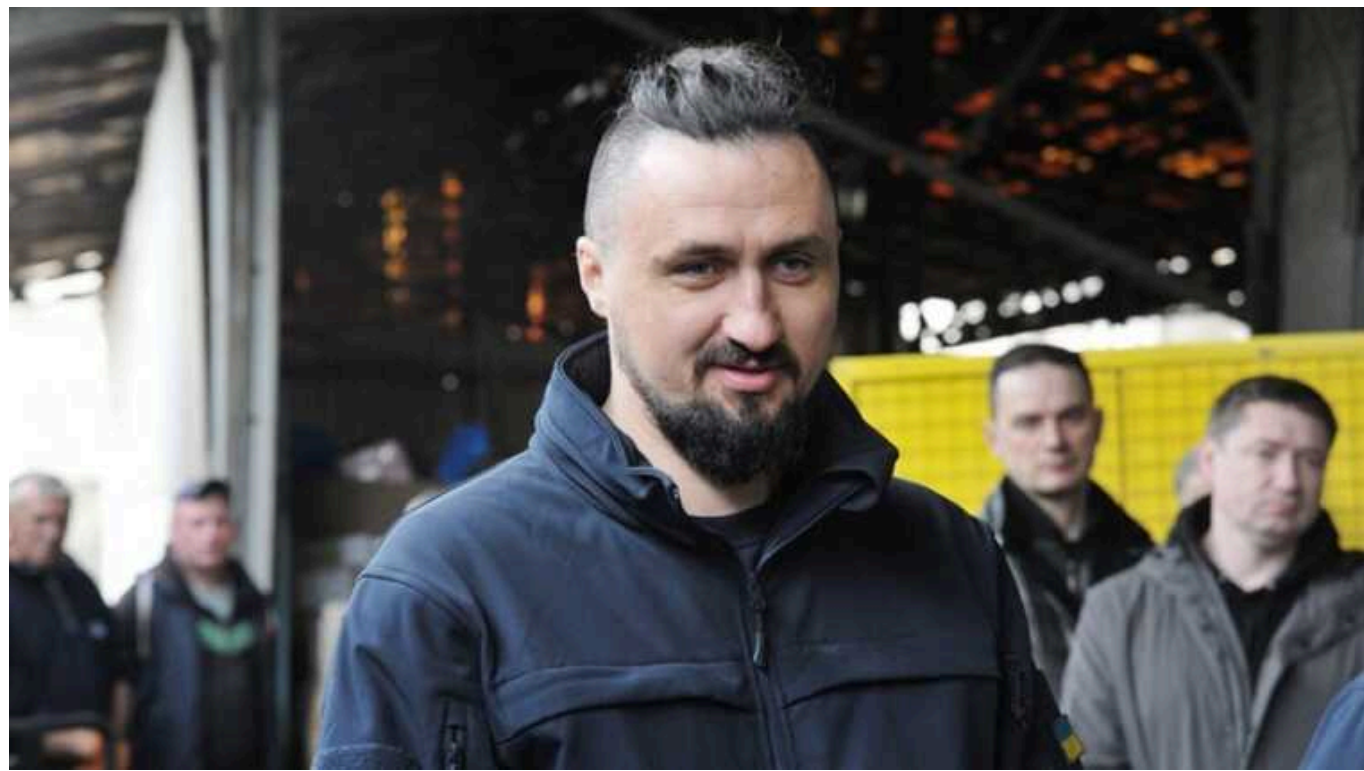
У нас з'явилася зброя, яка уразила ціль на відстані у 700 кілометрів, — Камишін

Міністр з питань стратегічних галузей промисловості України Олександр Камішін заявив, що в Україні з'явилася зброя, яка вразила ціль на відстані у 700 км.