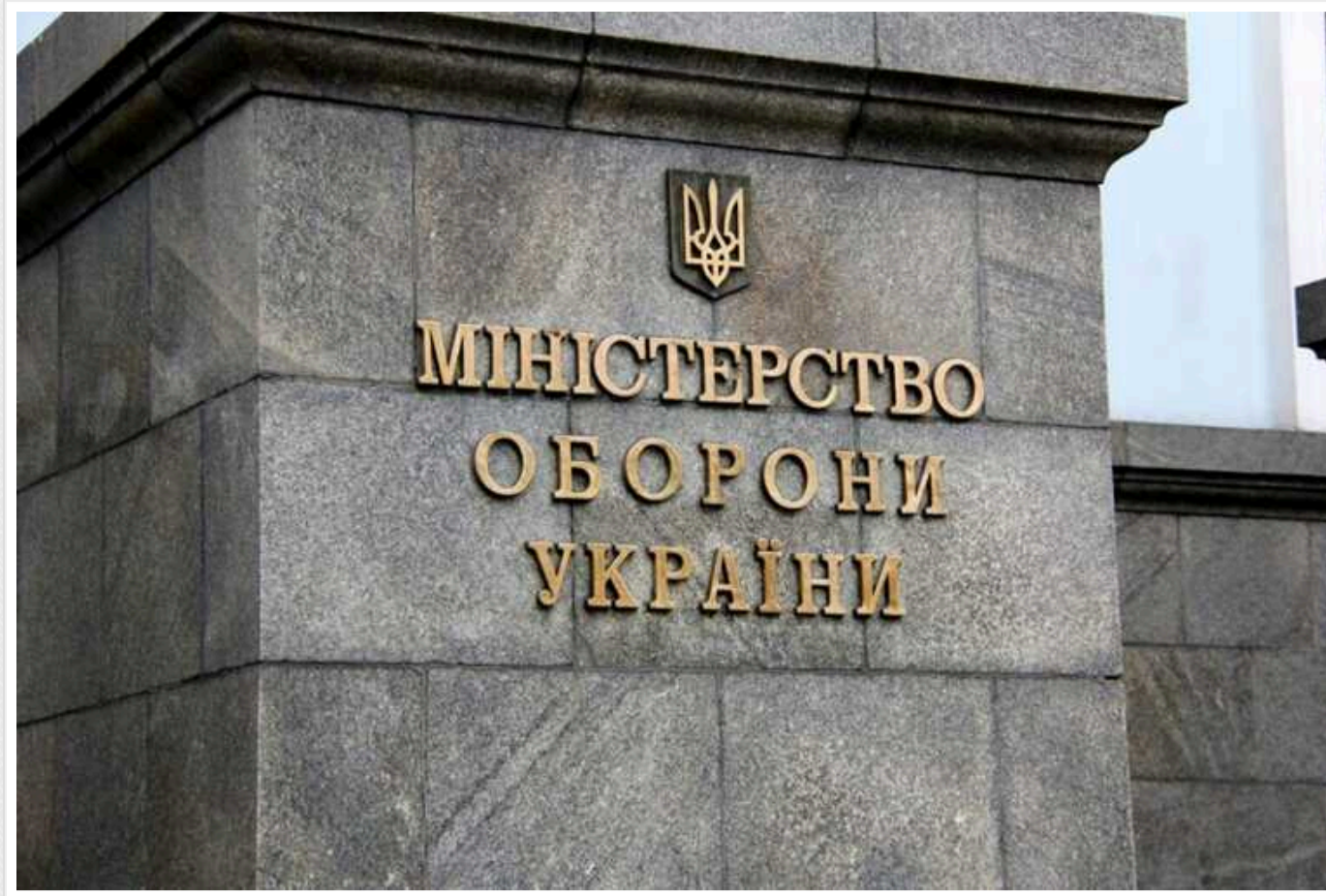
Міноборони: Половина зброї не постачається в Україну вчасно

Половина постачань зброї не приходять в Україну вчасно. Це ускладнює роботу на фронті.