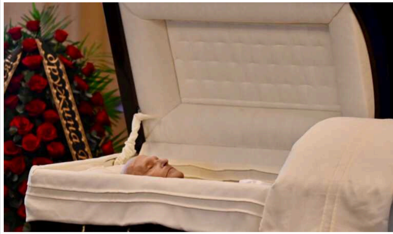
У Києві розпочалося прощання з українським дисидентом Степаном Хмарою, який помер 21 лютого

Прощання відбувається у консерваторії імені Чайковського.