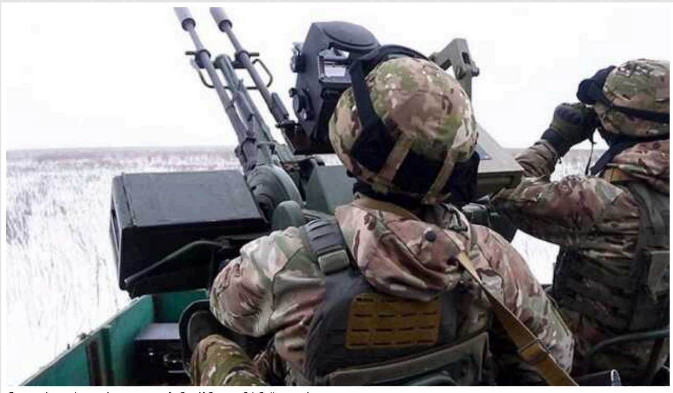
Ситуація на фронті: за минулу добу відбулося 84 бойових зіткнення

Протягом минулої доби на фронті відбулося 84 бойових зіткнення.