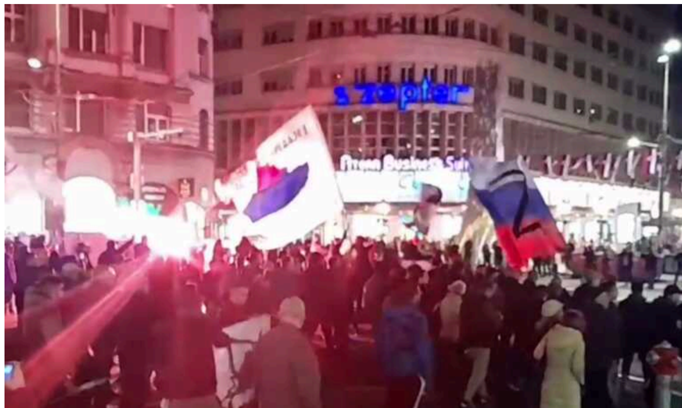
У столиці Сербії Белграді сьогодні пройшов марш на підтримку РФ

Сотні маргіналіє зібралися біля пам'ятника російському імператору Николаю II, щоб підтримати злочинні дії Росії в Україні.