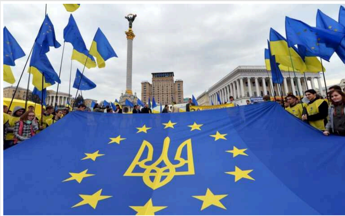
Східна Європа все більше розчарується в Західній через недостатню підтримку України, - Bloomberg

Остання суперечка через нездатність Європейського Союзу вчасно відправити Україні один мільйон артилерійських снарядів стала свідченням глибшого розколу між Західною та Східною Європою.