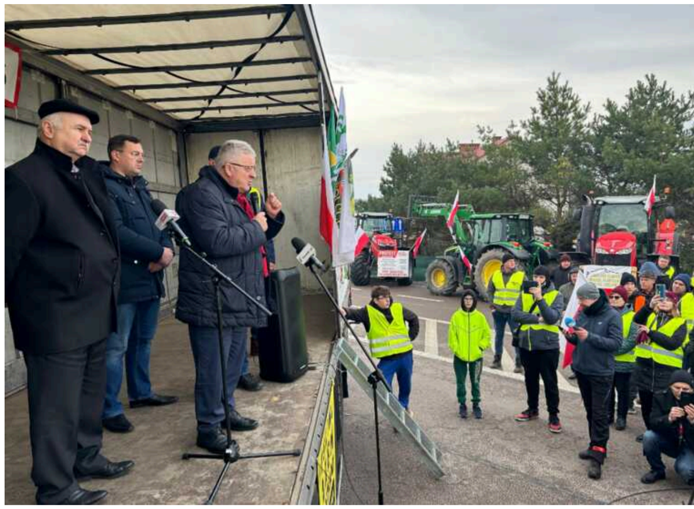
У Польщі на протестах фермерів знову з'явилися плакати з пропутінськими гаслами

На акції протесту польських фермерів у прикордонному селі Зосині, що в Люблінському воєводстві, 24 лютого знову з'явилися плакати з пропутінськими гаслами, від яких організатори відхрещуються.