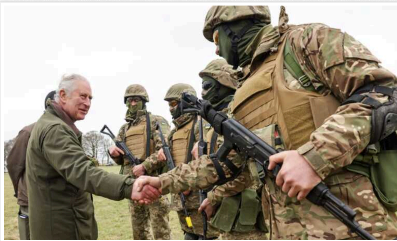
Король Чарльз III звернувся до українців у другі роковини великої війни: "Рішучість і сила українського народу продовжує надихати"

Король Великої Британії Чарльз III у другі роковини повномасштабного вторгнення Росії в Україну звернувся до вільного народу незламної країни. Монарх висловив захоплення сміливістю українців, які вступають у "трагічний третій рік" великої війни.