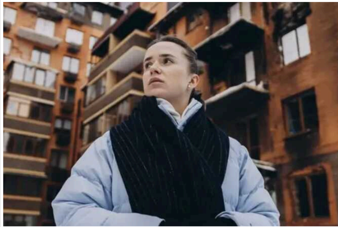
Кожен має воювати на своєму фронті, – Світоліна про підтримку ЗСУ

Перша ракетка України Еліна Світоліна дала невелике інтерв'ю BBC, де зокрема торкнулася того, як важливо підтримувати українських військових. За словами тенісистки, кожен має робити те, що він добре вміє.