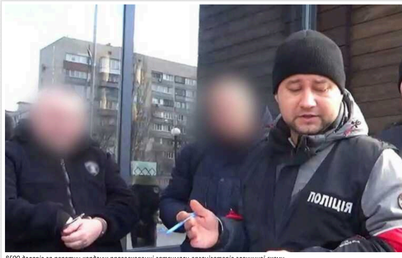
8500 доларів за перетин кордону: правоохоронці затримали організаторів злочинної схеми

За таку суму зловмисники обіцяли організувати можливість незаконного перетину державного кордону особам призовного віку.