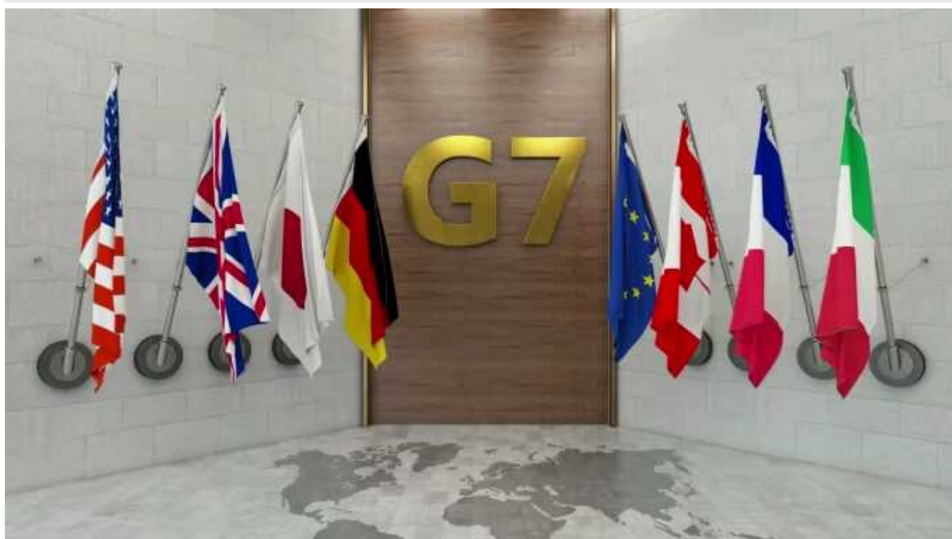
G7 обіцяє посилювати санкції та блокувати російські активи до кінця війни

Лідери "Групи семи" продовжуватимуть позбавляти Росію доходів для ведення повномасштабної війни проти України та карати треті країни, які їй допомагають у цьому, а також блокуватимуть активи РФ до кінця війни.