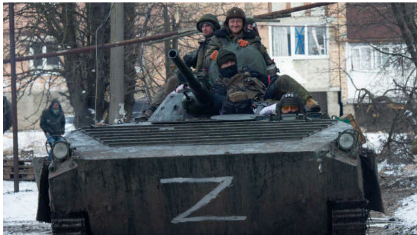
DeepState: Загарбники окупували Ласточкине, що біля Авдіївки

Російські війська окупували селище Ласточкине, що на захід від Авдіївки.