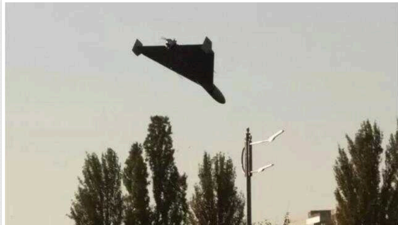
В Україні оголошено повітряну тривогу: окупанти запустили "Шахеди"

Увечері в суботу, 24 лютого, у деяких областях України було оголошено повітряну тривогу. Її оголосили через те, що російські окупанти знову атакували Україну дронами-камікадзе на кшталт Shahed.