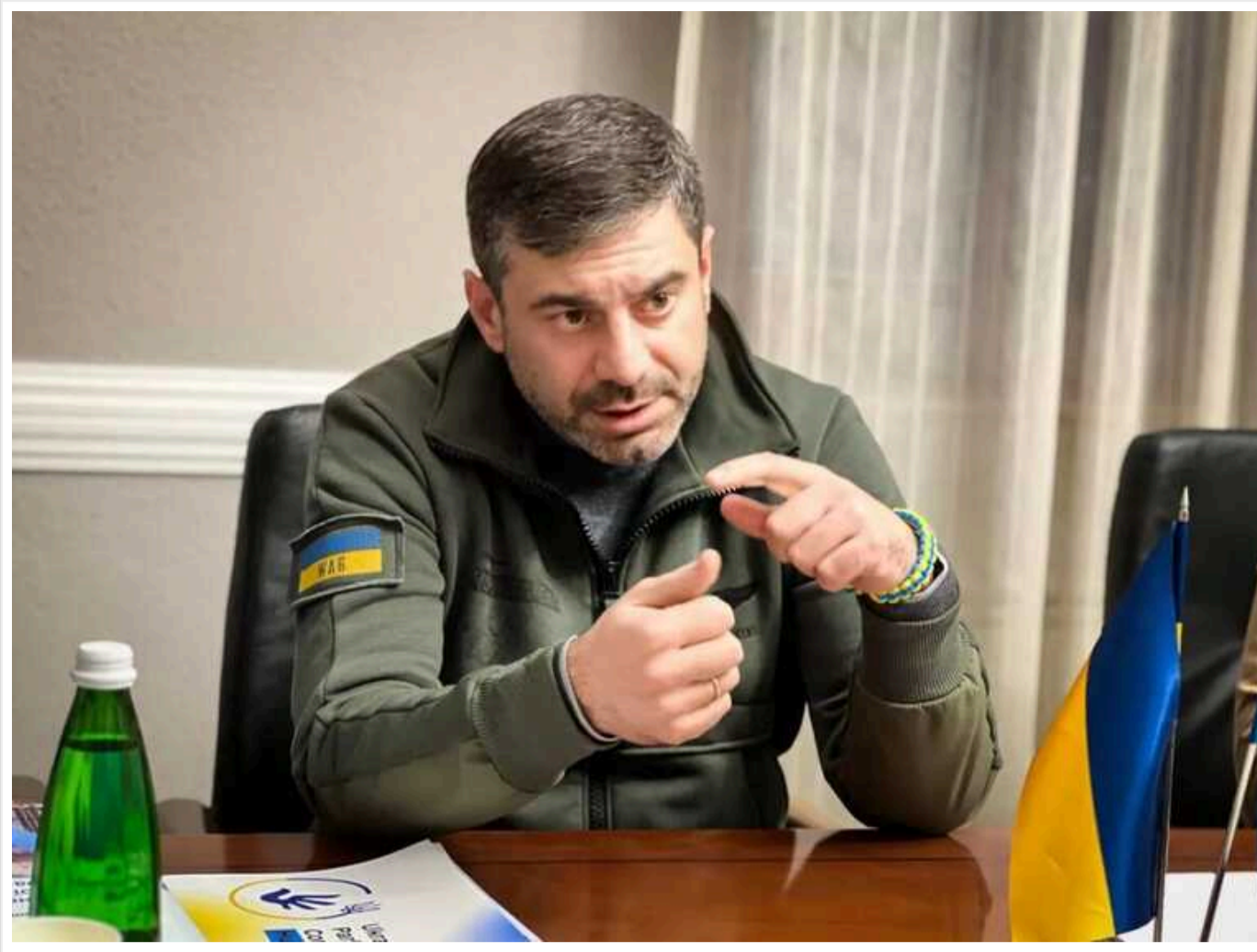
Розстріл українських полонених в Авдіївці: омбудсмен розкрив подробиці

Україна мала домовленості з Росією щодо поранених військових, яких не змогли евакуювати з Авдіївки. Але росіяни цинічно порушили ці домовленості.