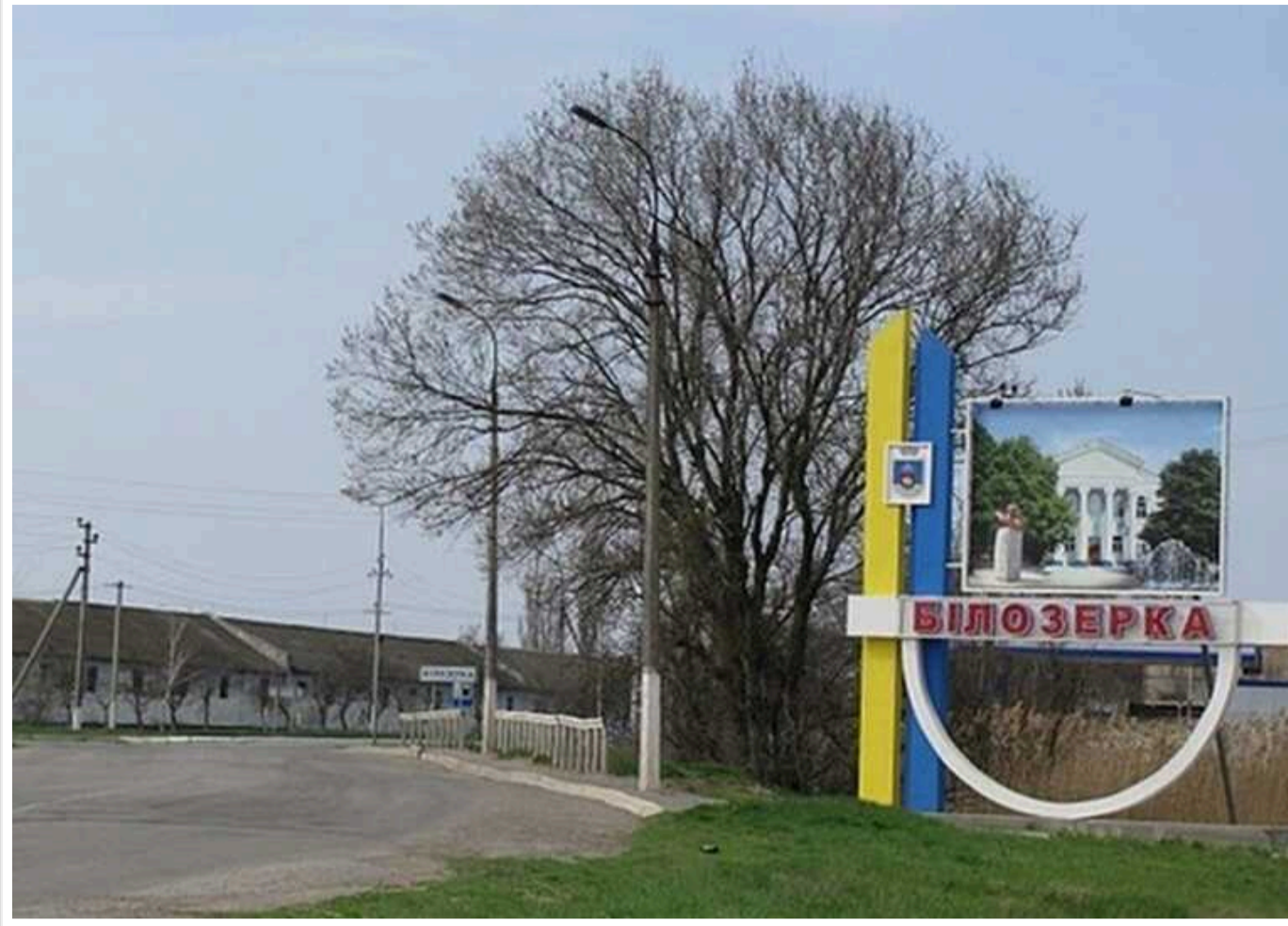
Окупанти завдали удару по Білозерці на Херсонщині: загинула жінка, 5 поранених

Унаслідок обстрілу росіянами Білозерки на Херсонщині загинула 35-річна жінка, поранено 5 осіб.