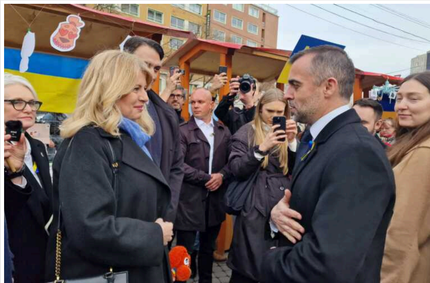
Президентка Словаччини на знак солідарності з Україною відвідала мітинг у Братиславі

Президентка Словаччини Зузана Чапутова висловила підтримку Україні на мітингу в столиці її країни Братиславі.