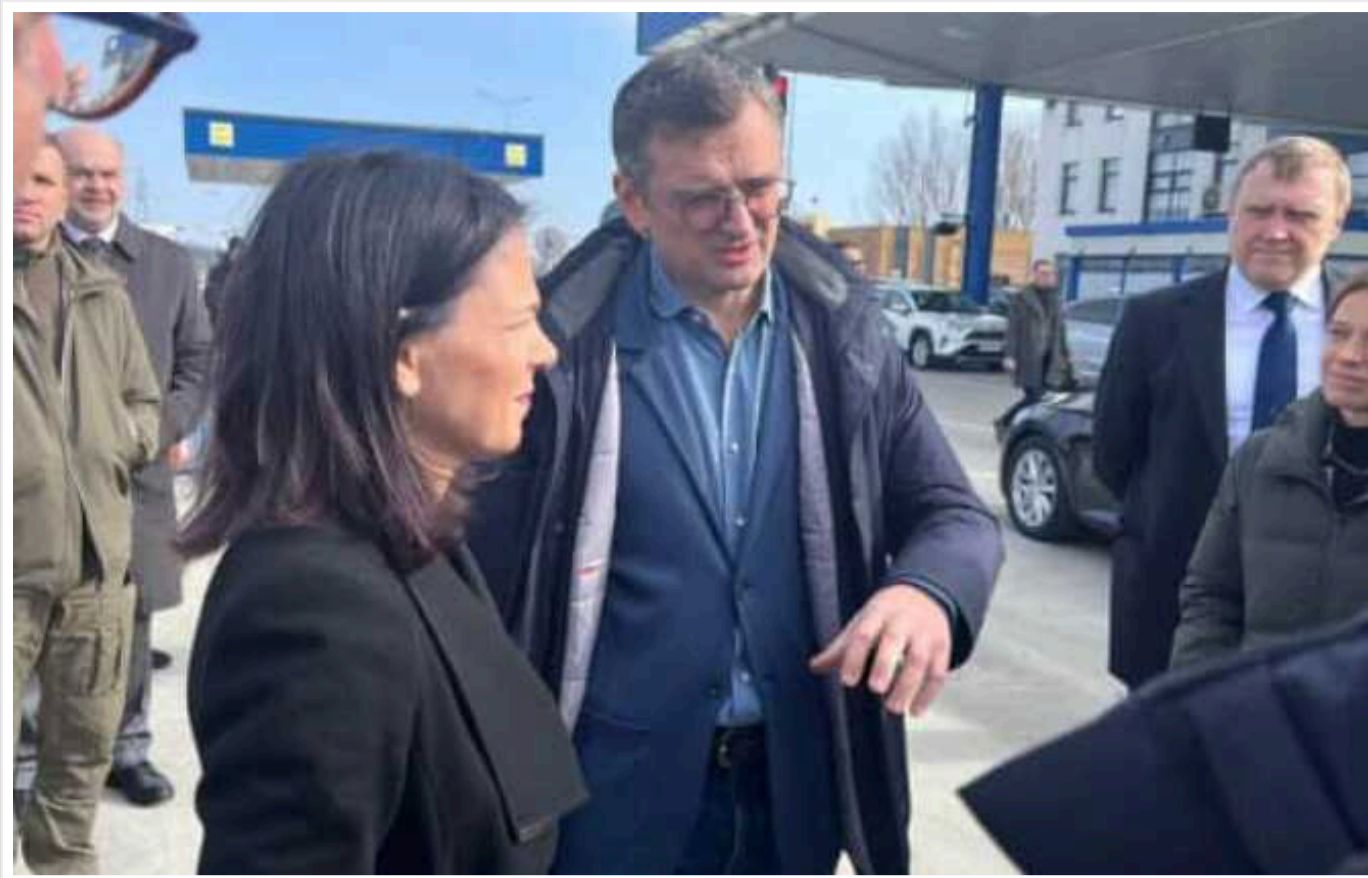
Голова МЗС Німеччини приїхала в Одесу на річницю повномасштабної війни

Міністерка закордонних справ Німеччини Анналена Бербок прибула з неоголошеним візитом до Одеси 24 лютого, у другу річницю повномасштабного вторгнення РФ в Україну.