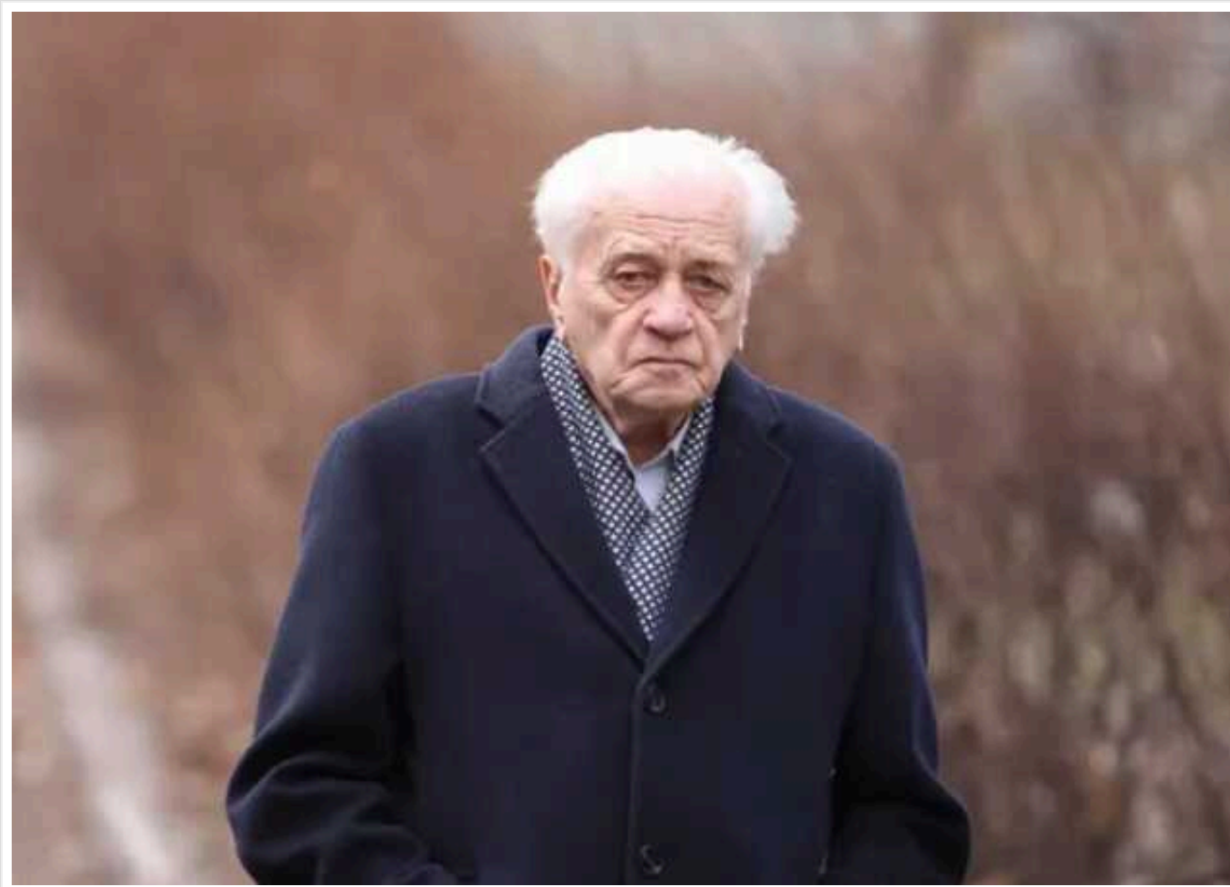
Дружина Степана Хмари назвала дату та місце прощання з борцем за незалежність України

Прощання з Героєм України Степаном Хмарою, який пішов у засвіти на 87-му році життя, відбудеться у неділю, 25 лютого, у Києві. Українці зможуть провести борця за незалежність нашої держави в останню путь на Майдані Незалежності (Консерваторія, вул. Архітектора Городецького 1-3/11).