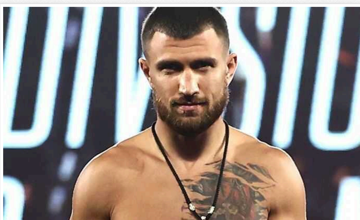
Вчинок Ломаченка спровокував ажіотаж росіян у Instagram: "Уся Росія топить за тебе!"

Колішній чемпіон світу у трьох вагових категоріях Василь Ломаченко (17-3, 11 КО) у себе в Instagram виклав проморалік свого нового бою, спровокувавши хвилю коментарів від російських фанатів. 35-річний уродженець Білгород-Дністровського 12 травня в австралійському Пертхі буде битися з 30-річним місцевим боксером Джорджем Камбососом (21-2, 10 КО).