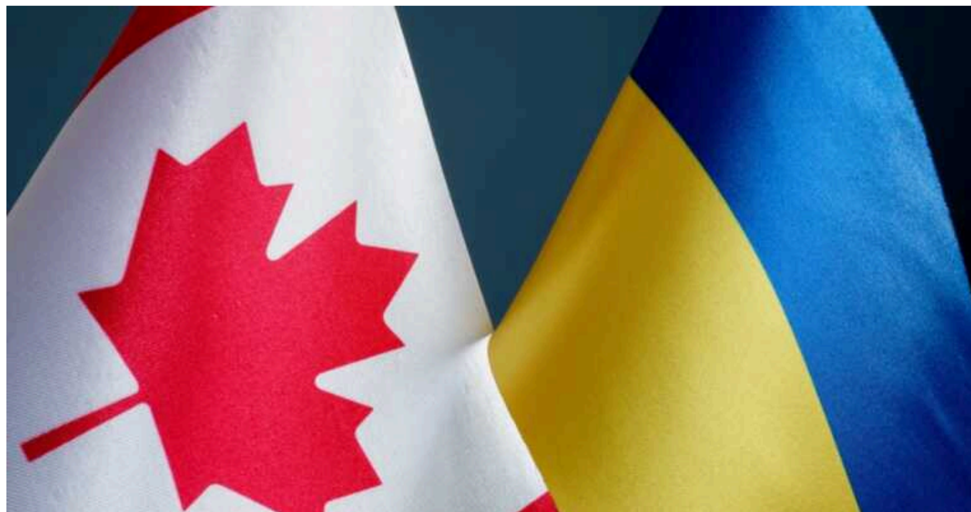
Стали відомі деталі безпекової угоди між Канадою та Україною

Заступник голови Офісу президента Ігор Жовква розкрив деталі угоди про співробітництво у сфері безпеки, яку підписали президент Володимир Зеленський і прем'єр-міністр Канади Джастін Трюдо 24 лютого у Києві.