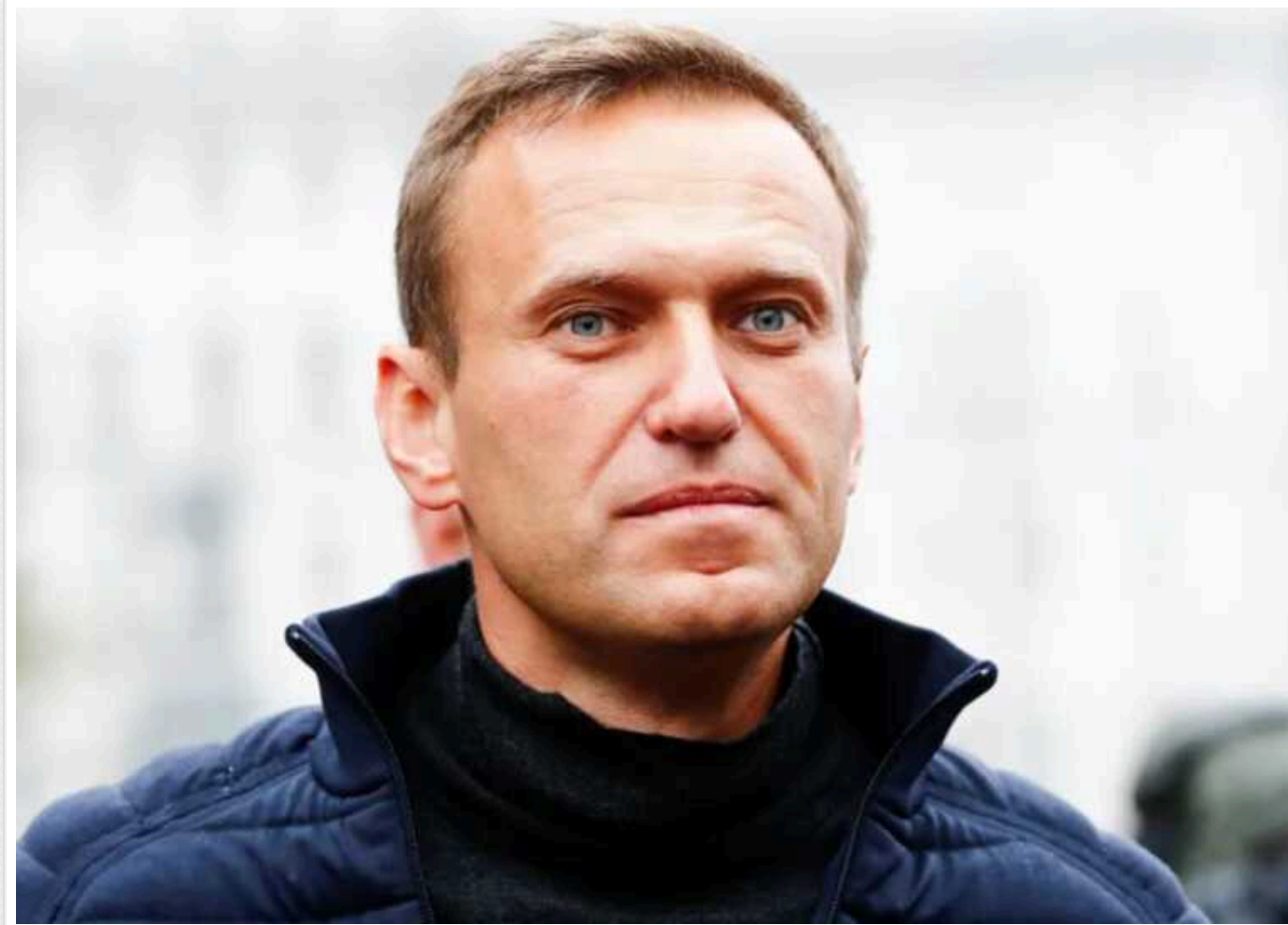
Соратники Навального запропонували силовикам по 20 000 євро за інформацію про вбивство політика

Матері російського опозиційного політика Олексія Навального поставили ультиматум: або вона погодиться на таємні похорони, або політика поховать у колонії.